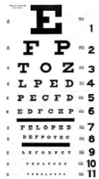
Tabla de snell

El glaucoma, comienza a generar pérdida de visión, no desde el campo central de la visión sino desde la periferia. Es decir el paciente con glaucoma tiene la posibilidad de leer de forma natural de lejos y de cerca, pero empieza a presentar pérdidas de visión en el contorno del objeto o punto fijo que esta mirando.